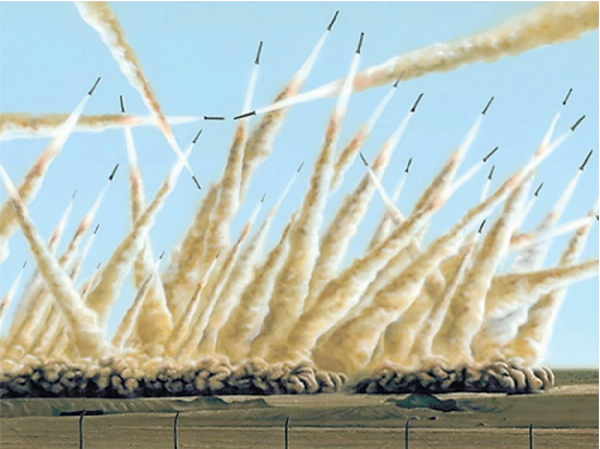
אוליבר לאריק, "Versions", 2010

מאחרים. המקורות לעבודות הן כולן דימויים המצויים ברשת, ללא תשלום, וכך לאריק מתייחס גם לשאלת הבעלות על דימויים, שהטכנולוגיה החדשה הופכת ליותר ויותר מאתגרת.