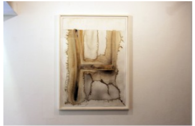
Micha Ullman - "Connected Vessels", installation view at Givon Art Gallery Untitled, 2016, watercolor on paper, 100x70 cm

Ullmann leaves nothing to console viewers, but shows the beauty in the decay