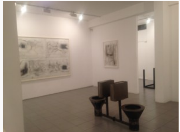
Connected Vessels Micha Ullman

For information about Art tours – please write to thewindowartsite@gmail.com