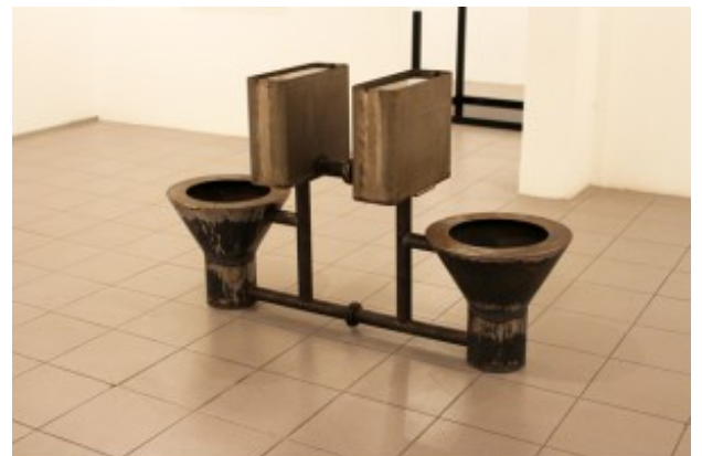
Micha Ullman - "Connected Vessels", installation view at Givon Art Gallery Two family's house, 2016, Iron, water, edition 1/3, 142x42x34 cm

עשוי מתכת מים והחלודה הנוצרת מהמפגש בין החומרים. הצרוף מנכיח את חלוף הזמן, את השבירות והפגיעות של מה שנדמה לנו איתן. הדימוין לעץ ספרות קבלי, ולא פחות מכך לשולחן נטוש ממקם את העבודה בין הפולחני רוחני ליומיומי, לגס, בין מיתוס עבר להתפוררות אפוקליפטית. אולמן, כמו אמנים רבים מאמצע המאה הקודמת (ריצארד סרה, טוני ריזן), משתמש בחלודה. שם התערוכה מרמזת לנסונות שלנו להסביר את העולם באופן מדעי (חוק כלים שלובים) וגם לתפיסות המיסטיות, במקרה זה היהודיות של הכלים ושבירת הגלים הקבלית כהסבר לקיום העולם כפי שאנו מיכירים אותו.